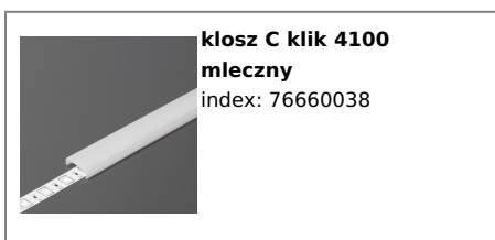
klosz C klik 4100 mleczny index: 76660038