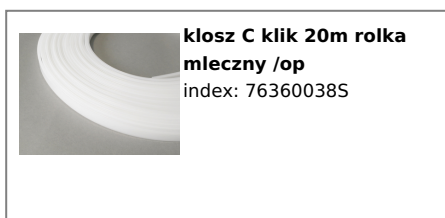
klosz C klik 20m rolka mleczny /op index: 76360038S